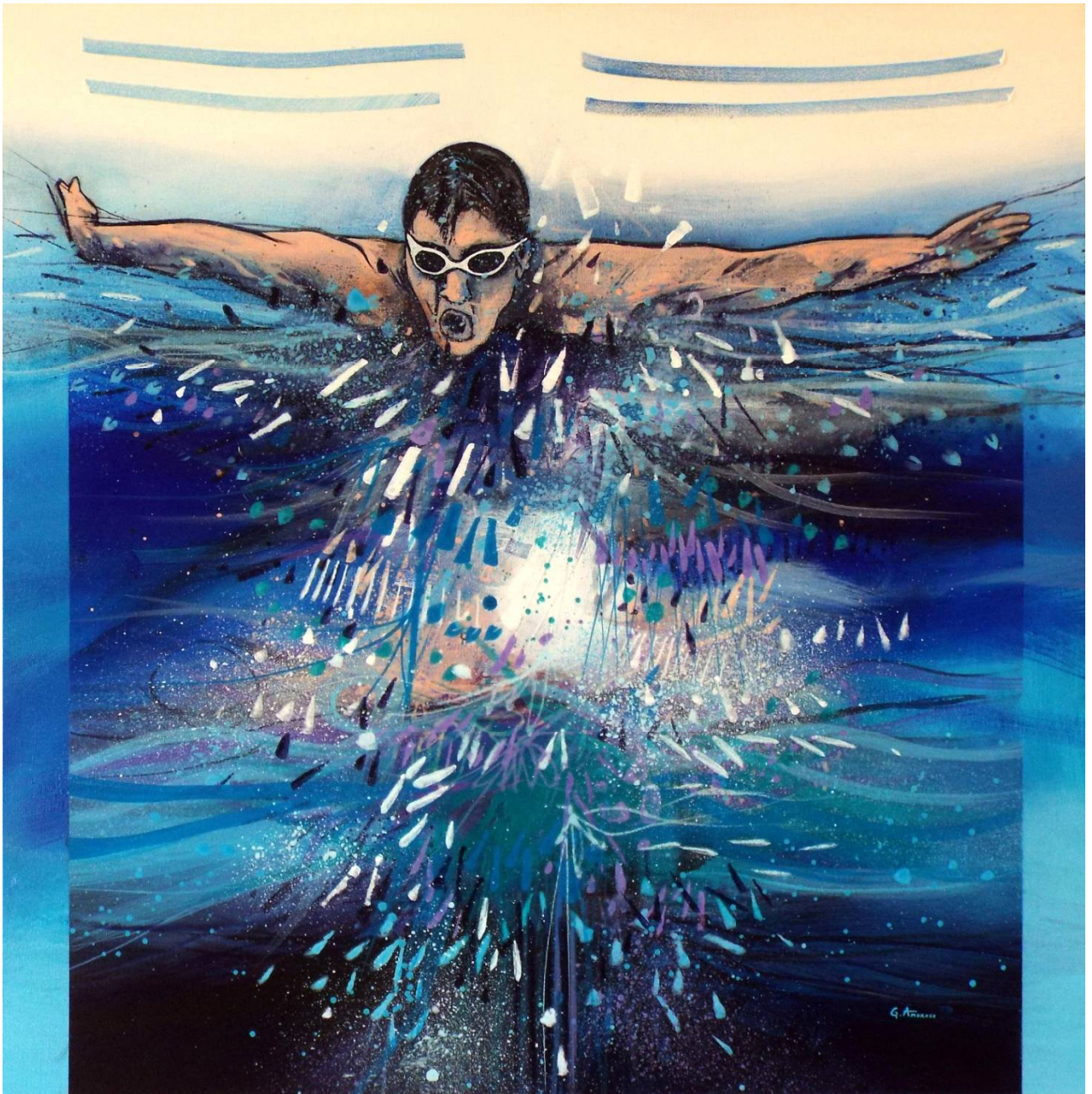
Giuseppe Amoroso De Respinis Acqua: Sport e Vita Acrilici su tela 80x80 cm