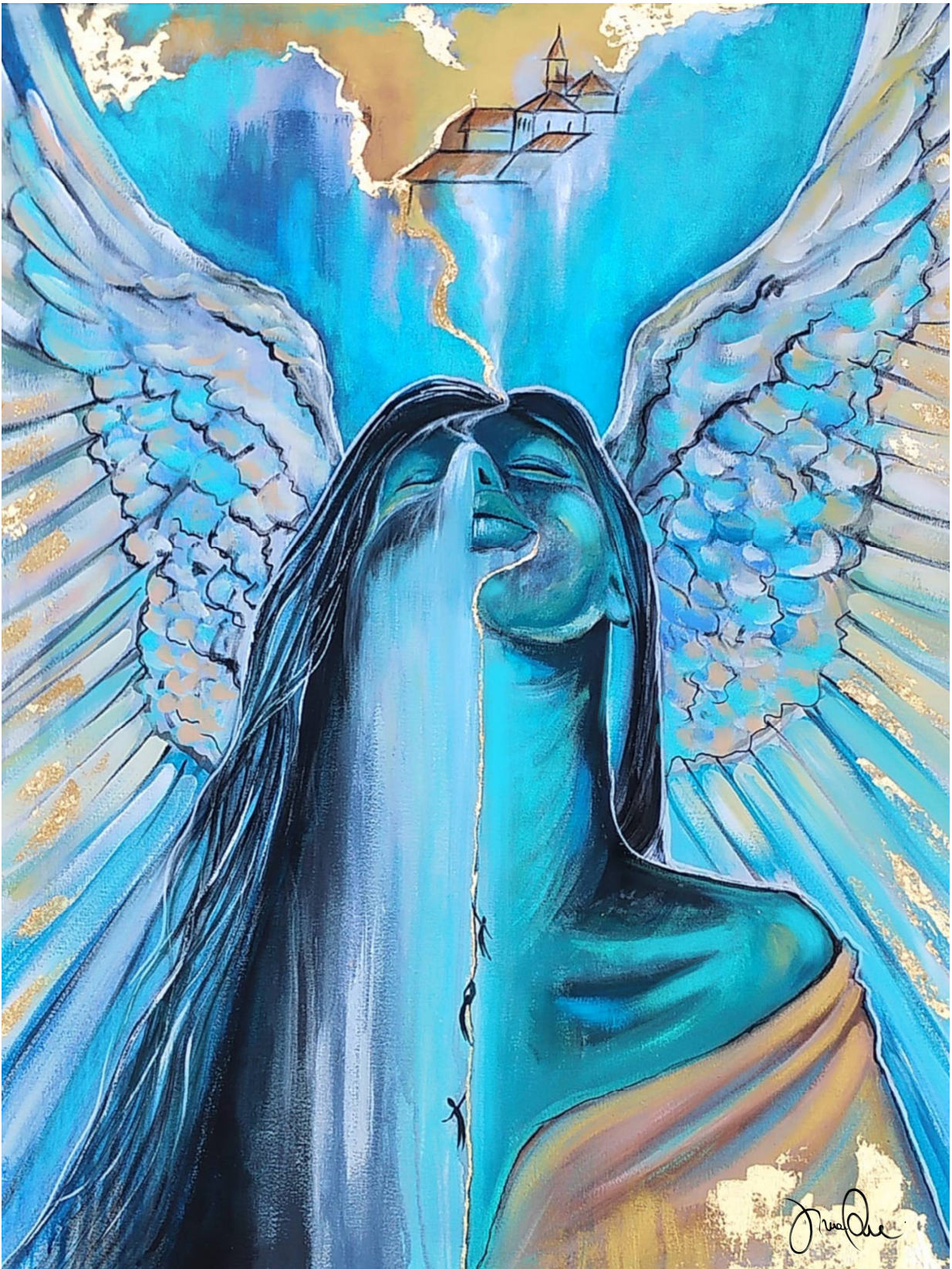
Dina Pascucci Angel of salvation Acrilici e foglia oro su tela 60x70 cm