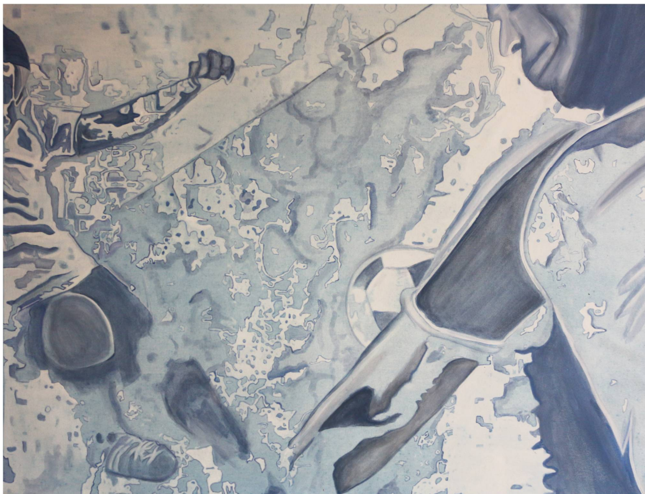
Moira Dell'Infante Sindone Sport Tecniche miste su tela 90x120 cm