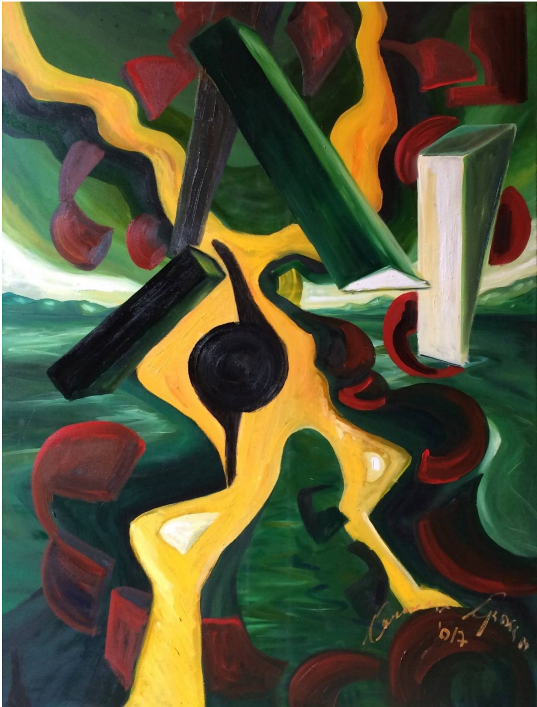
Carmine Grasso Cambiamento Olio su tela 70x100 cm